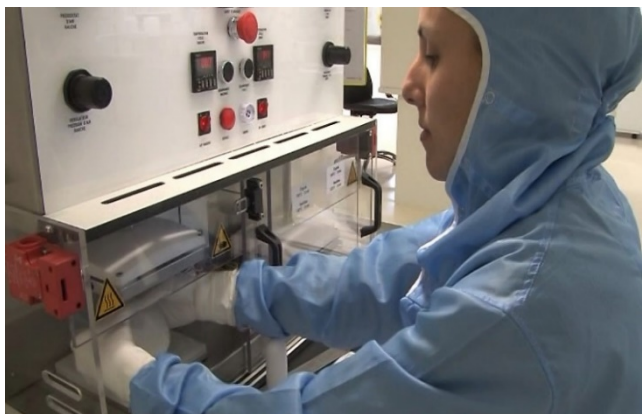
Рис. Одно из звеньев технологической цепи.

«Бабушка» наклеила на «пирожок» заплату и помещает его в печку для строго контролируемой термической спайки и опрессовки.